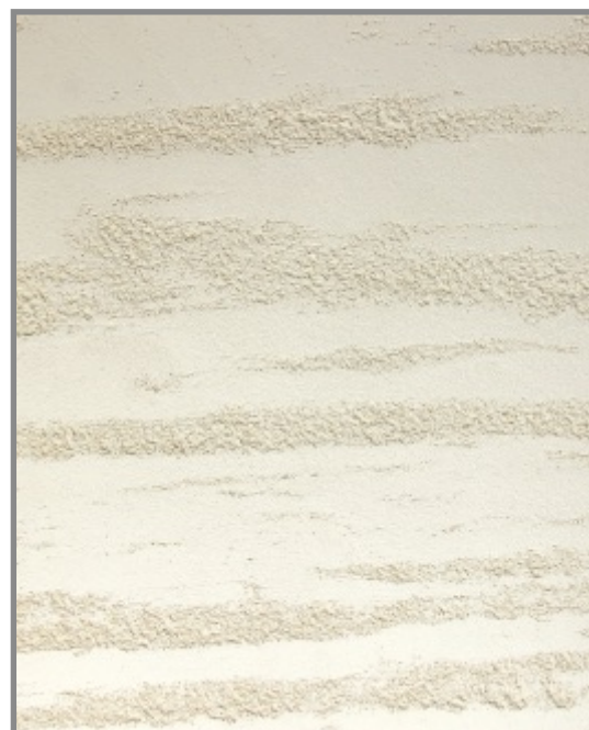
TRAVERTINO DUO BIANCO + PATINA DECOR

Chronić przed dziećmi, spożyciem, kontaktem z oczami, przedłużającym się kontaktem ze skórą. W wypadku kontaktu z oczami, przemyć dużą ilością wody i skontaktować się z lekarzem. Pomieszczenia zamknięte w czasie prac malarskich i po ich zakończeniu należy starannie wywietrzyć do zaniku specyficznego zapachu. Po tym okresie nadaje się do użytku. Nie wylewać do kanalizacji lub ciągów. Podane informacje wynikają z posiadanej najlepszej wiedzy i doświadczenia w wyjątkowych wypadkach mogą nie mieć zastosowania do właściwości i stanu konkretnego podłoża, które będzie pokrywane. Dlatego zalecane jest wykonanie próbnej aplikacji fragmentu podłoża przed wykonaniem całej powierzchni.