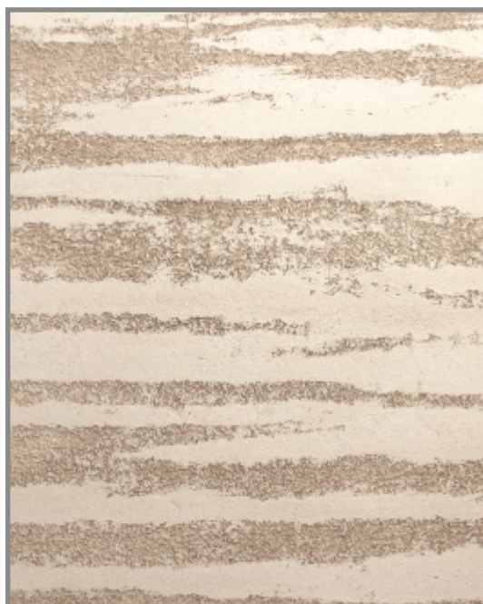
TRAVERTINO DUO BIANCO + PATINA DECOR + PATINA DECOR RD03P